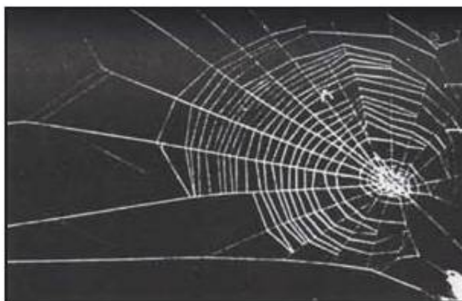
web of a spider on hashish