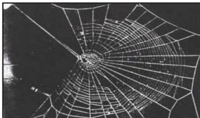
web of a spider on mescaline