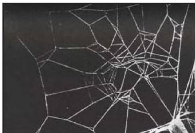
web of a spider on caffeine